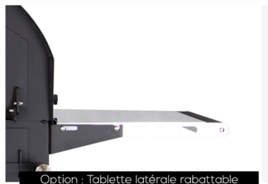
Option : Tablette latérale rabattable