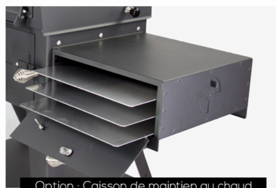
Option : Caisson de maintien au chaud